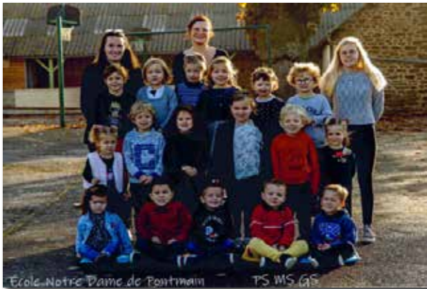
Petites - Moyennes et Grandes Sections

Les classes à cours multiples favorisent l'autonomie et la responsabilisation de chaque enfant. Vivre dans une telle école, c'est grandir et s'épanouir dans un climat de respect, d'écoute et d'entraide.