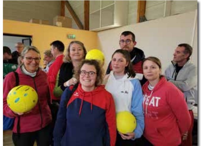
Les gagnants du tournoi d'Ambrières le 6 novembre.

Merci à tous ceux qui nous ont soutenus lors de l'organisation des 2 repas à emporter cette année. Et nous espérons qu'en 2022, le tournoi et le méchoui pourront se dérouler normalement.