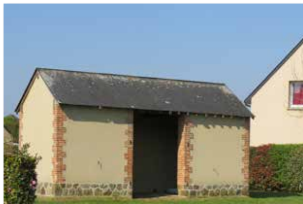
Bâtiment actuel rue de la Gare