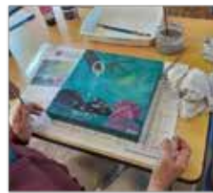
Les ateliers peinture pour apprendre et se détendre