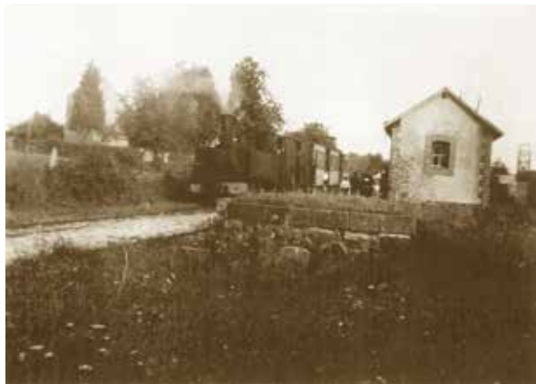
Situation de la gare de Brecé

Le bâtiment qui constituait la gare de Brecé existe toujours et se situe dans la rue qui porte son nom « la rue de la Gare ». Construite à la fin du 19ème siècle, la gare fut inaugurée en 1901 . Ainsi, il était possible de prendre le train en gare de Brecé , station de 2ème classe avec une seule voie de garage.