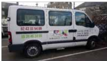
Le minibus pour se rendre aux ateliers si vous ne pouvez pas vous déplacer