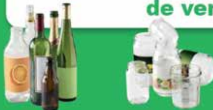
POTS, BOCAUX, BOUTELLES EN VERRE ET BOUTELLES DE PARFUM

Les opercules, capsules et couvercles sont à mettre dans le conteneur jaune .