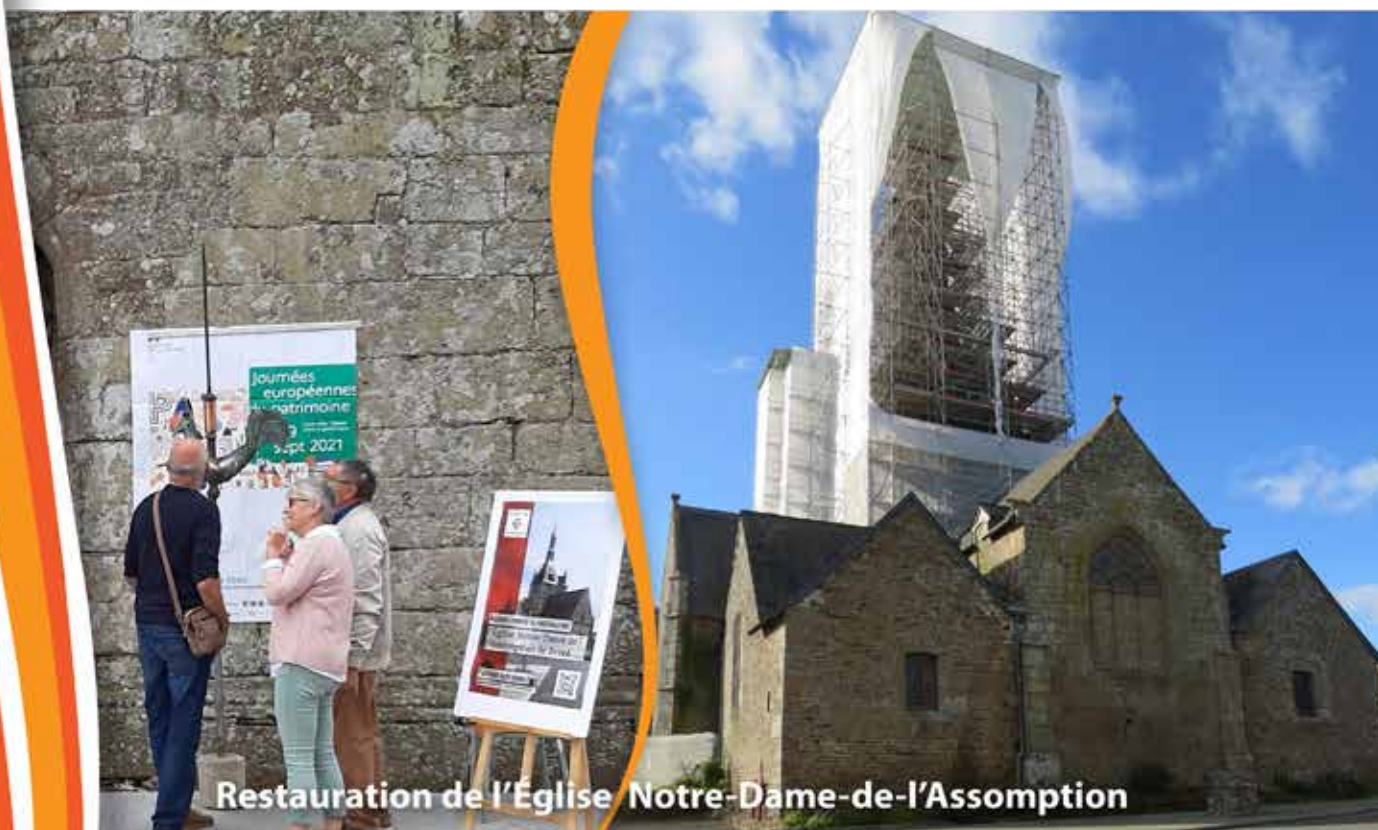
Restauration de l'Église Notre-Dame-de-l'Assomption