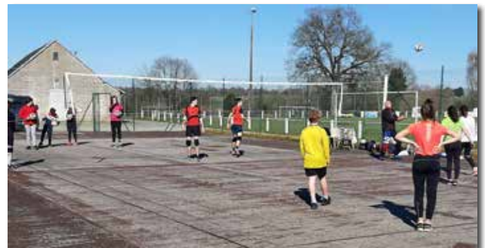
Entrainement en extérieur pendant les restrictions