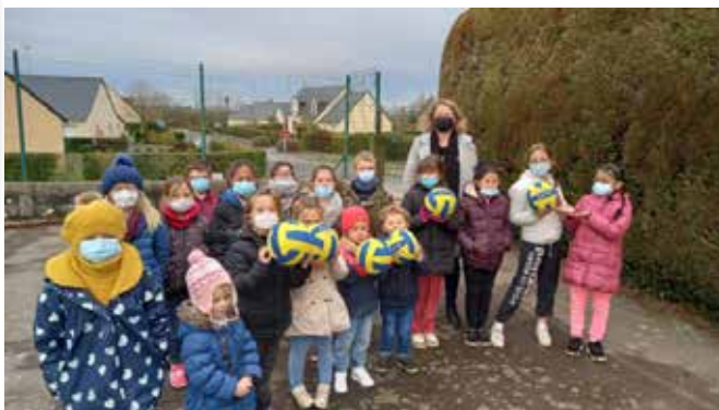
Don ballons école de Brecé