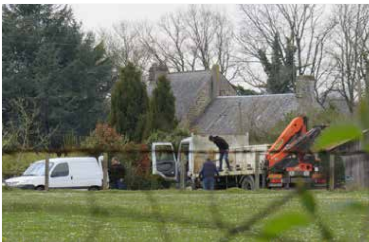
Rempoissonnement depuis la Mochonnière

Sur 100 € versés au titre des cartes de pêche, 10 € reviennent à l' AAPPMA de Gorrion et 10 € pour la réciprocité. Toutefois, cela ne suffit à couvrir les frais de rempoissonnement. C'est pour cela que l' AAPPMA de Gorrion organise des événements permettant d'avoir des fonds suffisants. La Communauté de Communes du Bocage Mayennais contribue également à faire vivre les actions de la société de pêche par le biais d'une subvention. Un contrat de restauration des cours d'eau de 2 x 5 ans a été conclu également avec la CCBM . Le deuxième volet du contrat est en cours.