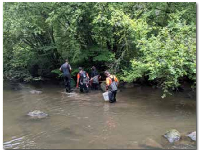
Pêche Electrique « Saut au Loup »

Rempoissonnements prévus en 2022 : env. 600 kg de truites Arc en Ciel, 160 kg de truites Fario, 60 000 truitelles fario nées à l'écloserie de Colombiers-du-Plessis. Les œufs sont éclos sur place et relâchés au bout de 6 semaines en tête de bassins (petits ruisseaux)