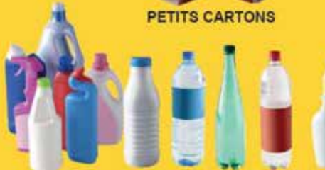
BOUTELLES ET FLACONS EN PLASTIQUE