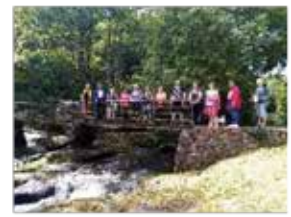
La marche nordique pour découvrir son territoire