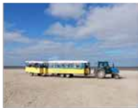
Sortie en petit train marin avec l'EHPAD de Fongerolles