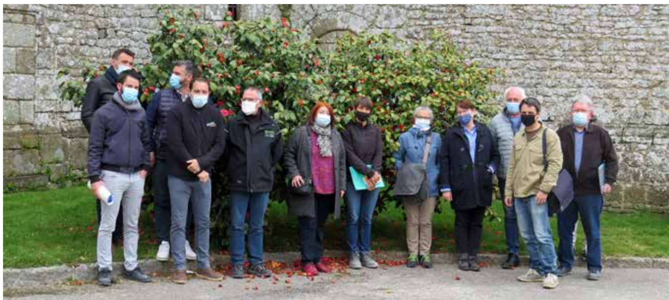
1 ère réunion de chantier - Rénovation de l'église